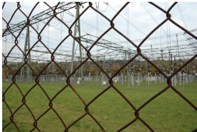
Risque de pénurie de courant, consommation d'énergie accrue: l'efficacité énergétique est au cœur du débat politique.

Dans le contexte des débats parlementaires ayant trait à la Loi fédérale sur l'approvisionnement en électricité (LApEl) et à