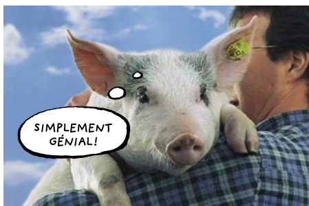
Cochon avec installation de biogaz